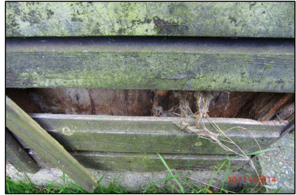
Abb. 5. Potenzielle Nist- und Quartiermöglichkeit am Bungalow 7 - Dämmung vorhanden