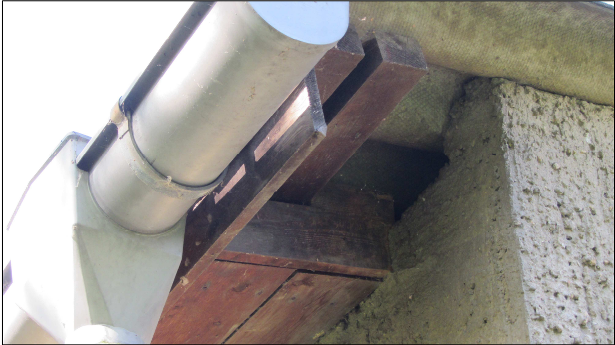
Abb. 1: Potenzielle Nist- und Quartiermöglichkeit am Sozialgebäude