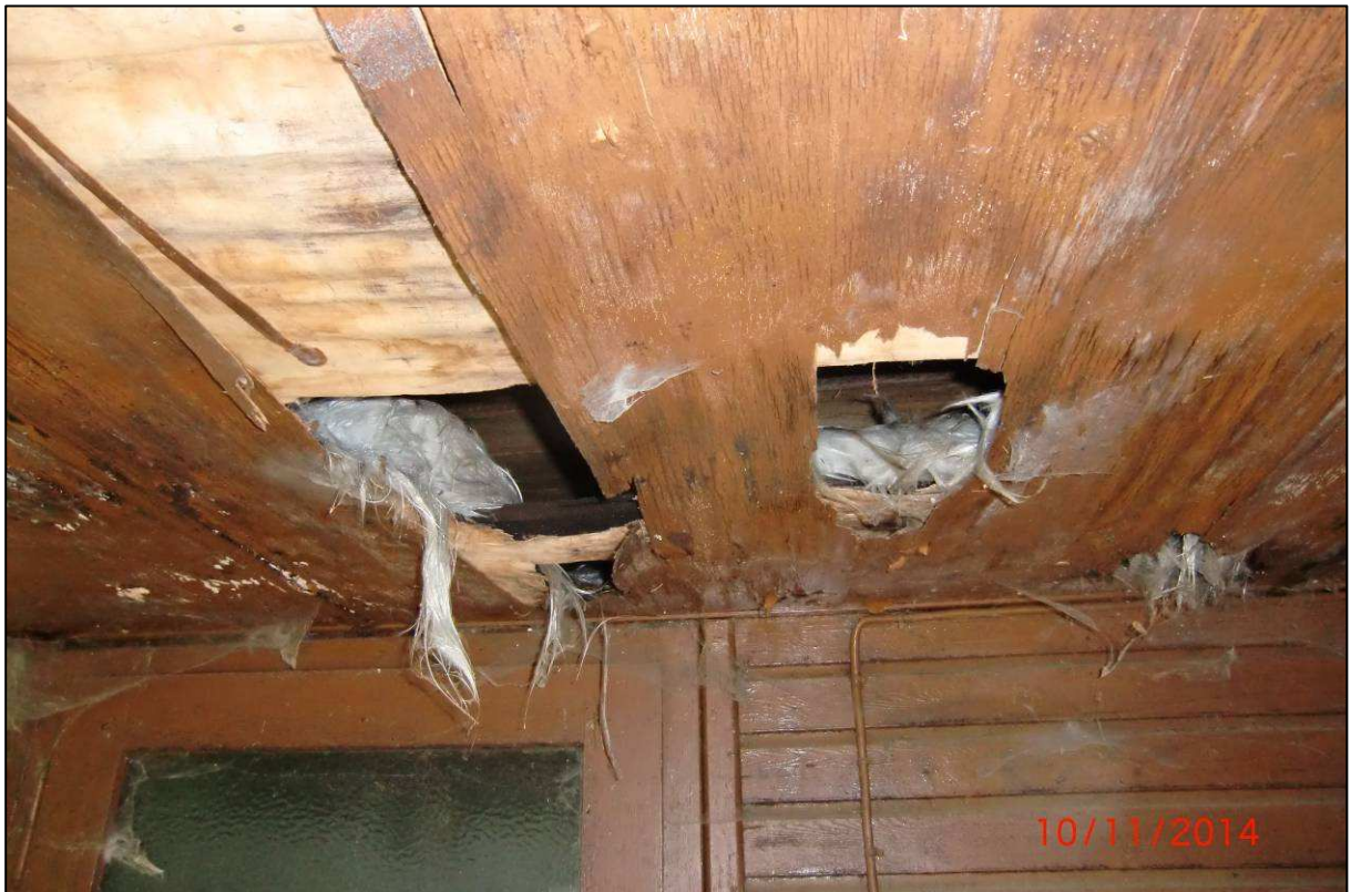
Abb. 6. Potenzielle Nist- und Quartiermöglichkeit am Bungalow 9