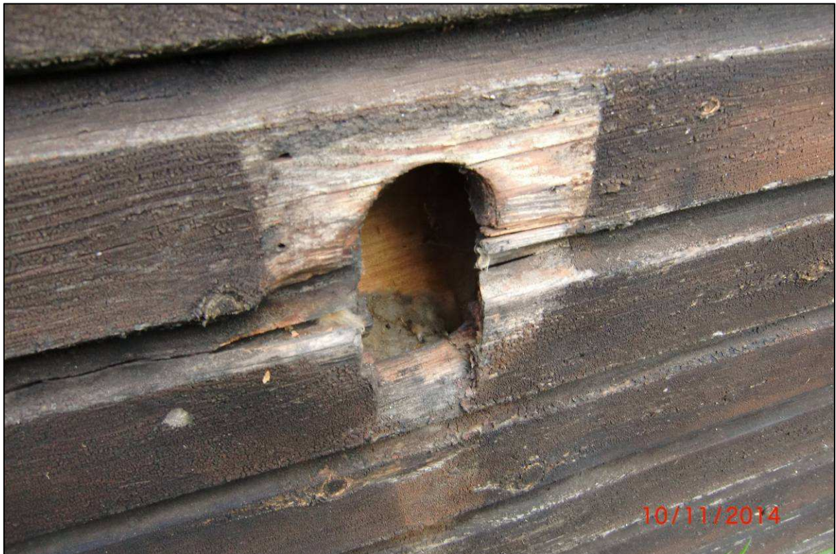
Abb. 4: Fassadenschaden an Bungalow 4 - Dämmung vorhanden