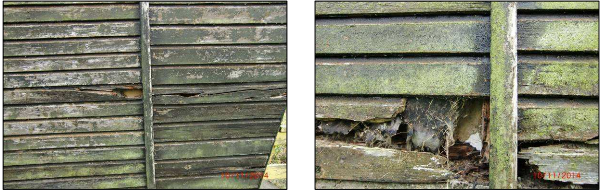
Abb. 3: Potenzielle Nist- und Quartiermöglichkeit am Bungalow 2