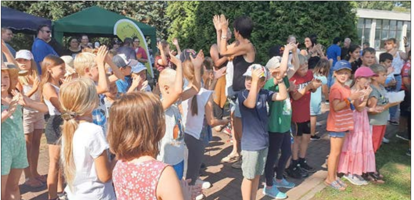
Abschluss der Sommerferien

Die Kinder und Erzieher vom Hort Droßdorf