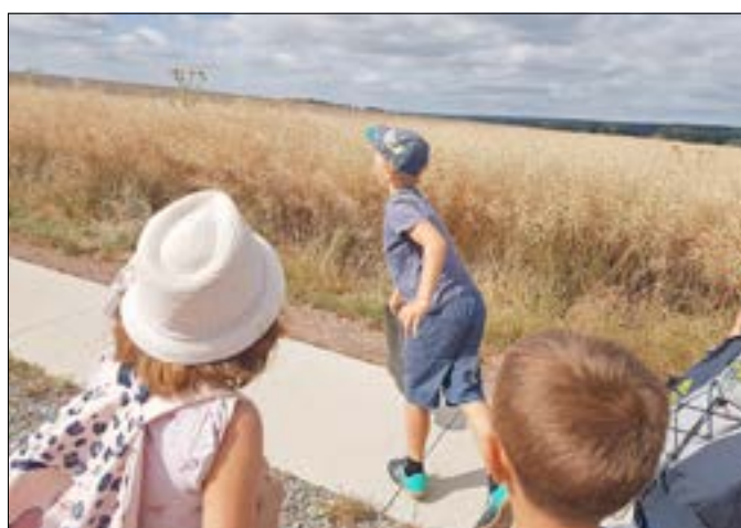
Bosselwanderung zu Bagel Bakery