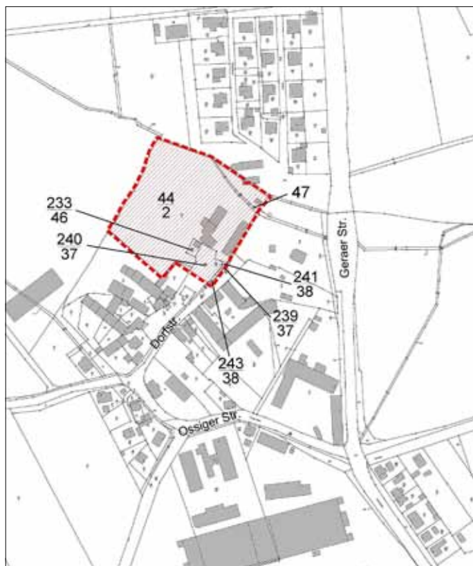
Übersichtslageplan Ortsteil Droßdorf mit Lage des Plangebietes – unmaßstäblich