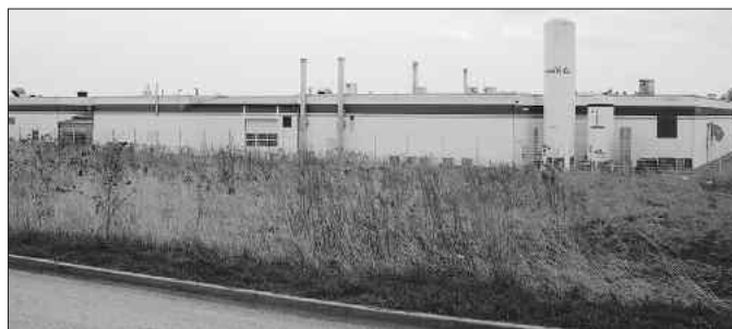
Zum Bau des Neuwerkes erwarb die Firma Sinnack eine zusätzliche Fläche von 1 ha

Standort, mit zukünftig knapp 200 Arbeitsplätzen zu den größten Arbeitgebern der Region. Bürgermeister Uwe Kraneis verwies in der Ratssitzung darauf, dass das Droßdorfer Gewerbegebiet dann einen Auslastungsgrad von ca. 80 % erreicht hat und dass dies für Droßdorf ein großer Erfolg ist, der die Gemeinde optimistisch in die Zukunft blicken lässt. Mit Abschluss der Investitionen wird dann die Firma Sinnack, deren Stammhaus sich in Bocholt befindet, eine Jahresproduktion von über 2 Mrd. Brötchen auf den Markt bringen. Die Produkte werden von Droßdorf aus europaweit exportiert.