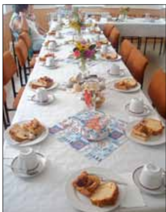
Kaffeenachmittag mit Rezepten aus Holland

Diese halfen bei Textunsicherheit. Wir hatten viel Spaß beim Singen.