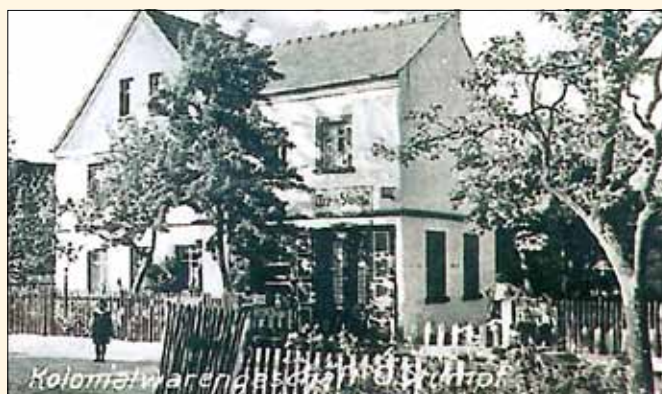
Der Kolonialwarenladen von Otto Stumpf (Sohn von Moritz Stumpf) in den 1930er-Jahren. Das Gebäude wurde um eine Etage erhöht.