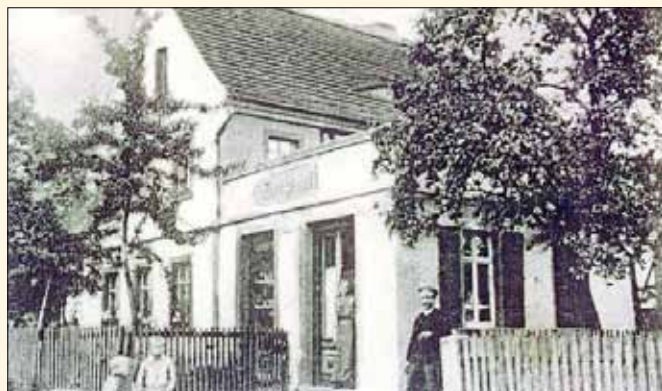
Kolonialwarenladen Moritz Stumpf um 1900

Die Fortsetzung erfolgt im nächsten Amtsblatt