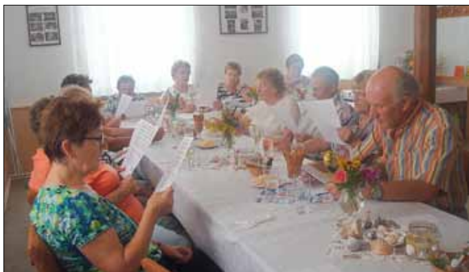
Gemeinsames Singen in Bröckkau