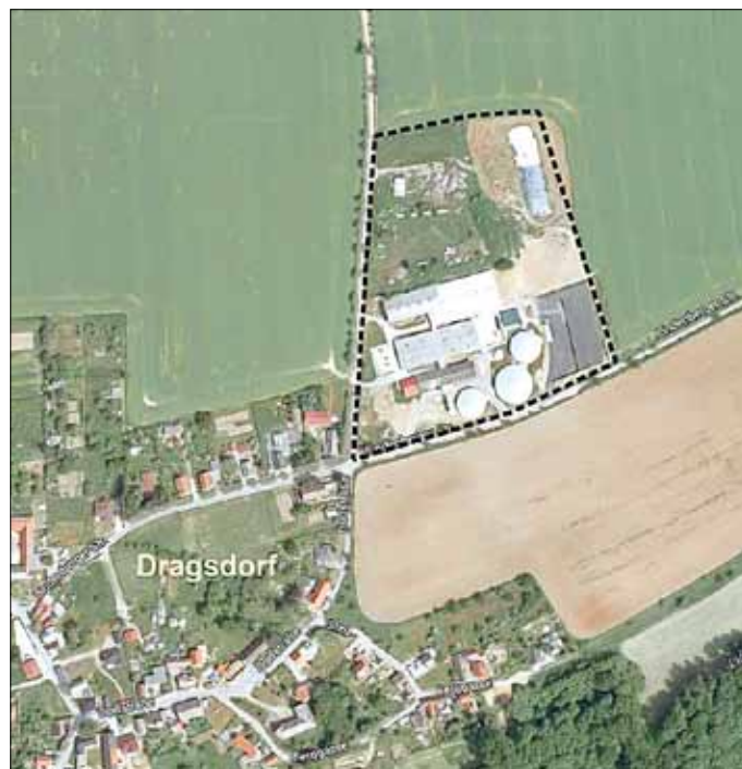
Lage des Plangebietes - unmaßstäblich

Flur: 5, Flurstücke: 94/3 und 94/4 und Flur: 6, Flurstücke: 22/10, 22/12, 46, 47, 48, 49, 50, 51, und Teilflächen des Flurstückes 52