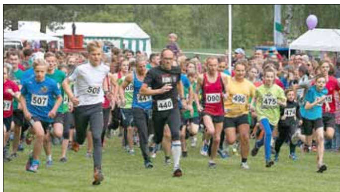
Der Startschuss für die Läufer ist gefallen, es geht auf die Strecke.

Die Online-Anmeldung ist der einfachste Weg zur Teilnahme am 37. Finnellauf. Auf der Internetseite des Finnellaufs unter www.finnellauf.de werden sowohl Formulare für Einzelanmeldungen als auch für Gruppen bzw. Vereine bereitgestellt. Meldeschluss ist der 24. April 2016. Nachmeldungen sind am Veranstaltungstag bis 30 Minuten vor Wettkampfbeginn gegen eine Gebühr von 2,00 € (zzgl. zur Startgebühr) auf dem Sportplatz in Tauhardt möglich.