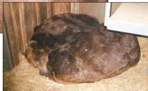
Eure Bären Toni und Aiko.“